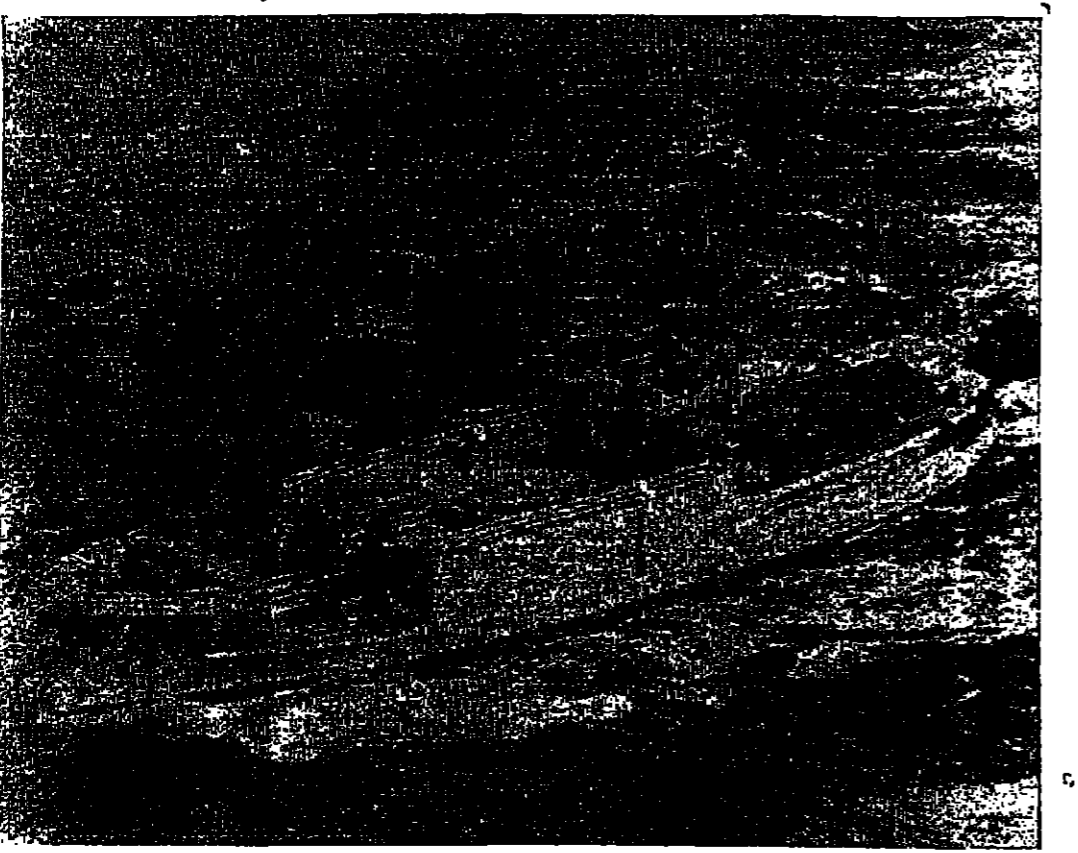
أحدى سفن التجسس الأمريكية وقطعت محل زبلتها ( بوبلو ) في المياه الكورية لتابعة عمليات الاستخبارات السليمة

التجسس يجري على قدم وساق... فوق الأرض وتحت الماء... وهي في السماء!